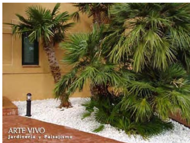
Grava blanca en zona de plantación anexa a entrada principal de vivienda en Dosbarrios, Toledo.