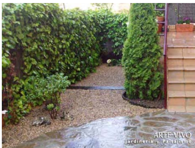
Pavimento de Gravilla Garbancillo con traviesa de ferrocarril anexo a solado de pizarra oxidada con mortero de cemento en jardín de Las Cárcavas, Madrid.