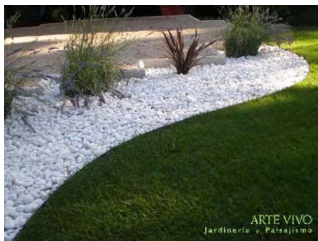
Pavimento de Bolo blanco en curva separado de césped artificial con fleje metálico Ever Edge en jardín de Pozuelo de Alarcón.