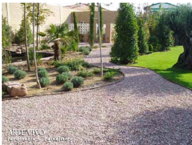
Pavimento de Gravilla Rojo Alicante en sendero con borde de fleje metálico en jardín de Dosbarrios, Toledo.