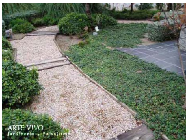
Sendero de Gravilla Garbancillo con ecotravesas y delimitado con listones de madera entre zonas de plantación. Barajas, Madrid.