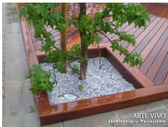
Alcorque formado con borde recto de Madera de Ipé sobre rastreles con suelo desnivelado cubierto con Gravilla Gris Perla. Edificio del Grupo TYPESA en San Sebastián de los Reyes.