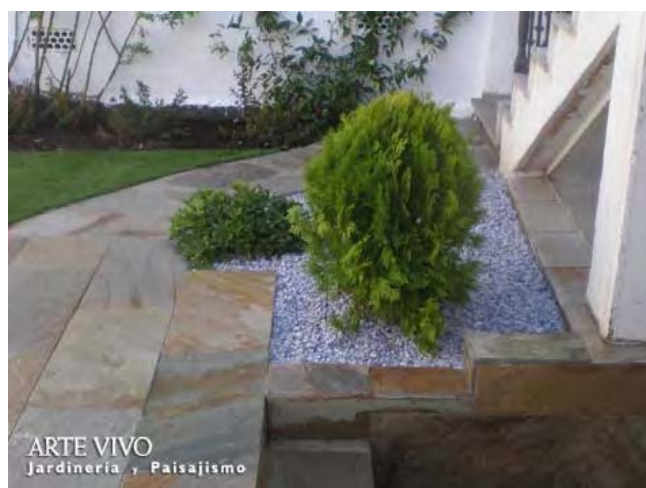
Gravilla Gris Perla en zona ajardinada entre césped artificial y pavimento regular de Cuarcita e irregular de Pizarra Oxidada. Perales del Río, Getafe.