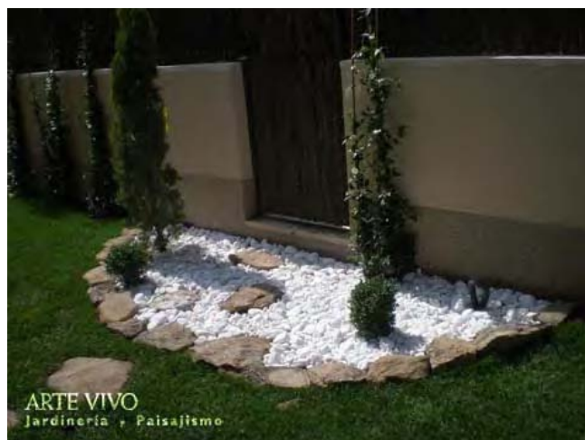
Pavimento de Bolo blanco con lajas y borde de Piedra de Musgo en entrada principal a vivienda de Torrelodones.