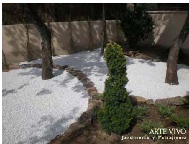
Zonas de plantación delimitadas con bordes de piedra de musgo y cubiertas con Gravilla Blanco Macael en jardín de Torrelodones, Madrid.