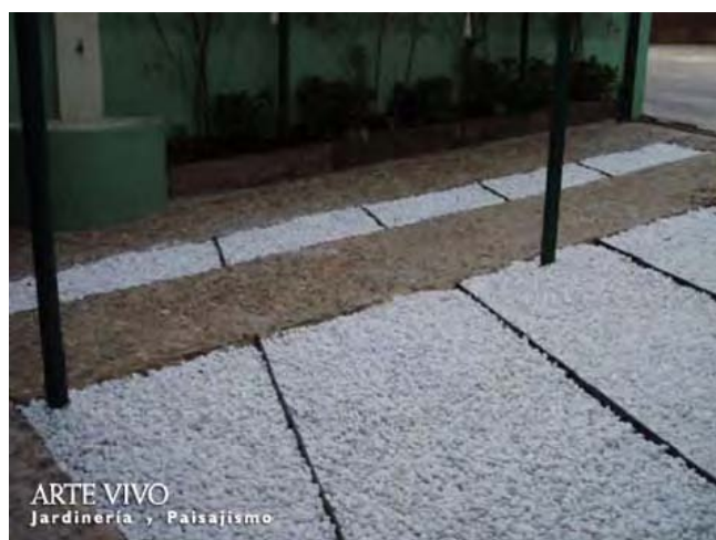
Pavimento de gravilla blanca con pletina metálica entre solado de baldosas en zona de entrada. Chamartín, Madrid.