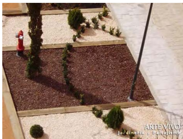
Ecotravesía con tinte marrón delimitando zona de plantación cubierta con Gravilla Roca Volcánica en patio ajardinado del Hotel NH Parla.