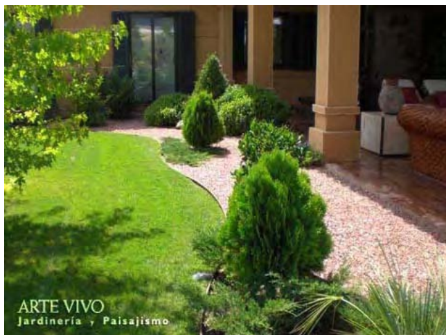
Zonas de plantación con gravilla Rojo Alicante y borde de fleje metálico junto a solado de porche en jardín de Dosbarrios, Toledo.