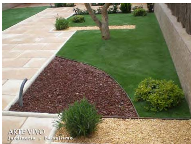
Gravilla Roca Volcánica en zona de plantación bordeada con fleje metálico entre césped artificial y solado de baldosa pétrea con bordillo de piedra artificial. Perales del Río, Getafe.