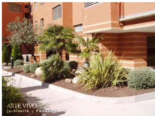
Zona ajardinada con Gravilla Roca Volcánica en comunidad de propietarios de Carabanchel, Madrid.