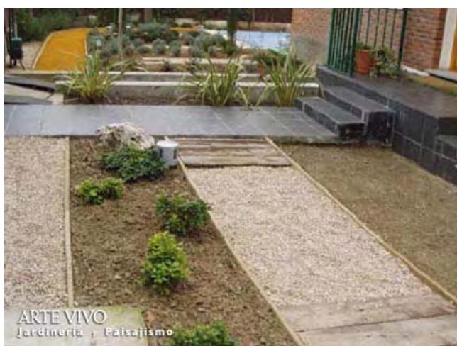
Gravilla Garbancillo como separación de zonas de plantación en costado de paseo a entrada principal de vivienda en Barajas, Madrid.