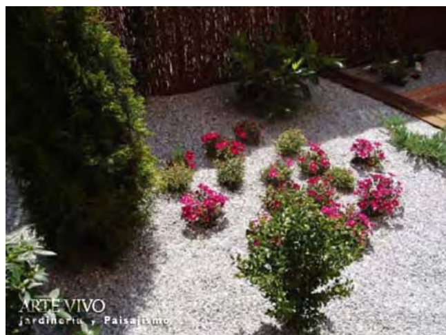
Zona de plantación con gravilla Gris Perla y delimitada con ecotravesas en jardín de San Blas en Madrid.