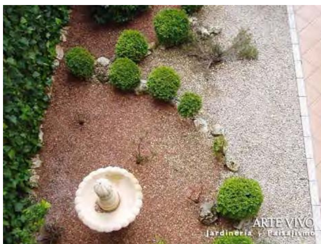
Mezcla de gravillas formando curva con piedras de rocalla y plantación en zona anexa a entrada de jardín en Rivas-Vaciamadrid.