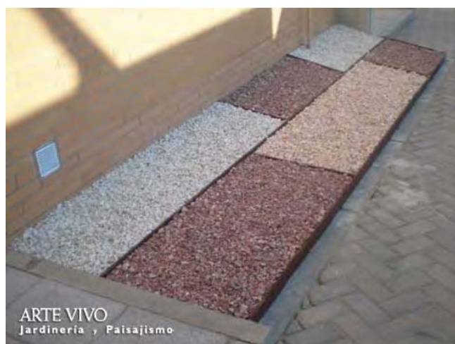
Zona anexa a entrada principal de vivienda decorada con Gravillas Rojo Alicante, Blanco Macael y Rosa Valencia y delimitadas por fleje metálico. Arroyomolinos.