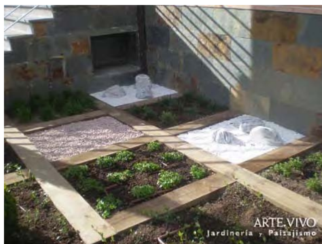
Zona de plantación con gravillas Rojo Alicante y Blanco Macael con bolos y delimitadas por ecotruviesas en entrada principal a vivienda de Pozuelo.