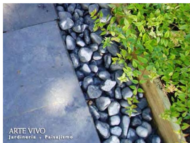
Bolo Gris junto a solado y plantación bordeada con listón de madera. La Florida, Madrid