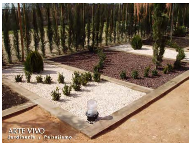
Bordes de Ecotraviesa con tinte marrón como separación de Gravillas Garbancillo y Roca Volcánica. Hotel NH Parla.