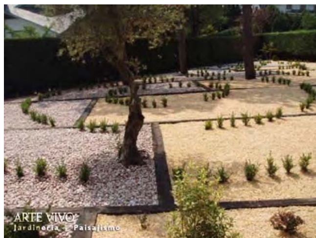
Ecotravesía con tinte negro como separación entre Gravilla Rosa Valencia y Bolo Rojo Alicante en jardín de entrada a vivienda en Navacerrada.