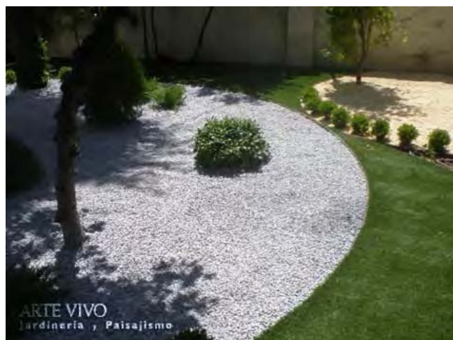
Gravillas Gris oscuro y Amarillo claro en zonas de plantación circulares definidas con fleje metálico entre césped artificial. Madrid centro.