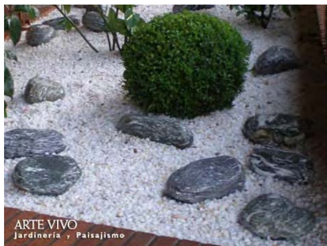
Bolos sobre Gravilla Garbancillo en jardineras de zona de entrada a viviendas en Legazpi, Madrid.