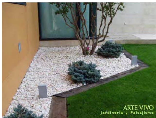
Zona de plantación con Bolo beige y Traviesas de ferrocarril junto a pradera de césped en jardín de vivienda en Fuente El Fresno, San Sebastián de los Reyes.