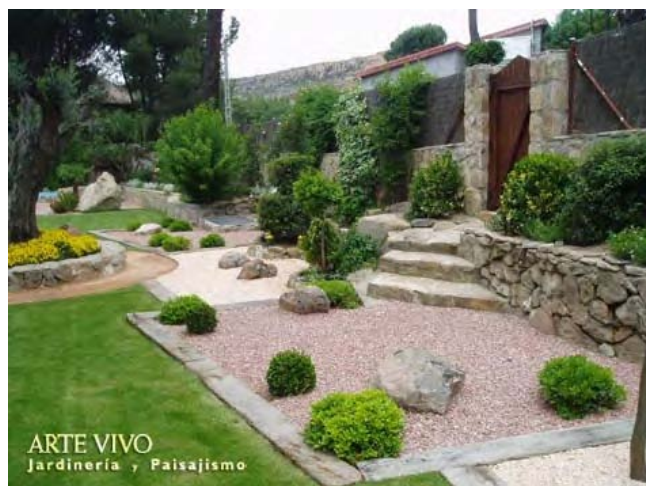
Entrada principal a vivienda con pavimento de gravillas Rojo Alicante y Rosa Valencia, separadas por ecotraviesas y alternadas con plantación y rocas. Cebreros, Ávila.