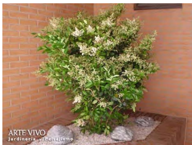
Jardinera de obra cubierta con Gravilla Garbancillo y decorada con bolos. Legazpi, Madrid.