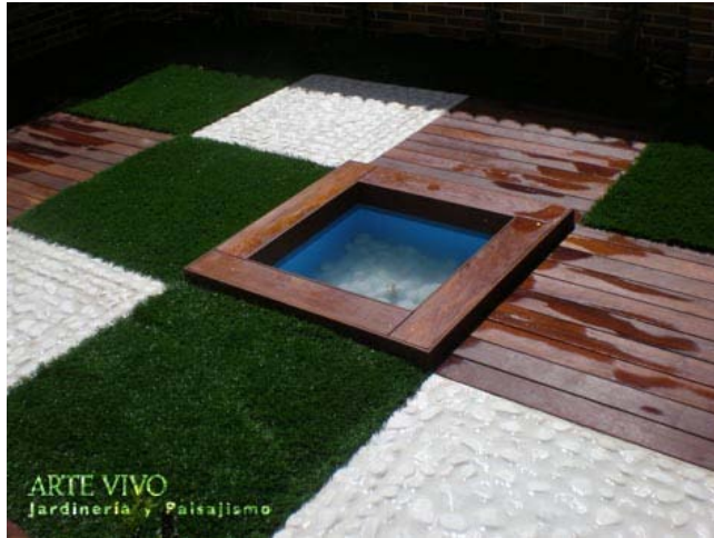
Estanque cuadrado con estructura de ladrillo, bomba sumergida y surtidor, con borde de Madera tropical de Ipé. Dehesa de la Villa, Madrid.