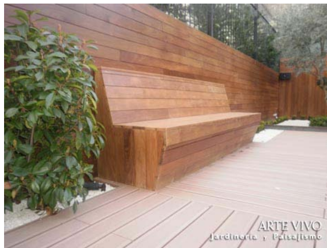
Banco con Madera de Ipé adosado a cerramiento del mismo material y sobre tarima tecnológica en jardín de Las Rozas, Madrid.