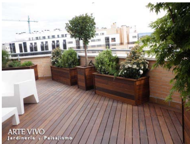
Paramentos de jardineras con tablas de Madera tropical de Ipé sobre tarima del mismo material en Ensanche de Vallecas, Madrid.