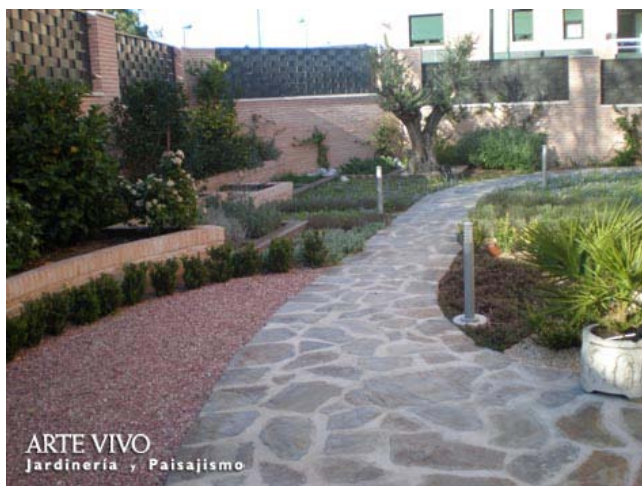
Pizarra oxidada sobre cemento en paseo entre zonas de gravillas y plantaciones en jardín particular con jardineras de ladrillo caravista en Pozuelo de Alarcón.