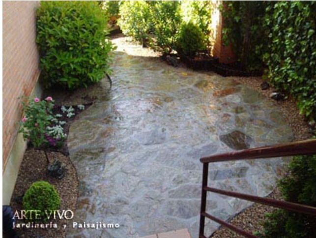
Detalle de ensanche en camino construido con lajas de Pizarra oxidada entre pavimentos de gravillas con plantaciones en laterales. Las Cárcavas, Madrid.