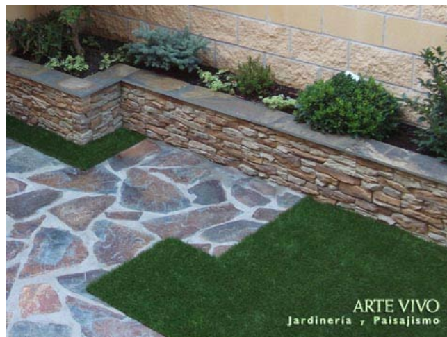
Detalle de solado regular de planchones de Pizarra irregular sobre solera de hormigón junto a jardineras de obra chapadas de Piedra premontada con cubremuros de Pizarra multicolor en jardín con césped ecológico de Torrejón de Ardoz, Madrid.